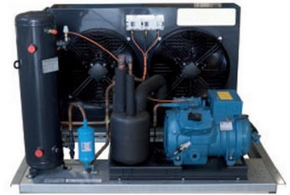
Imagen de ejemplo - su producto podría ser diferente